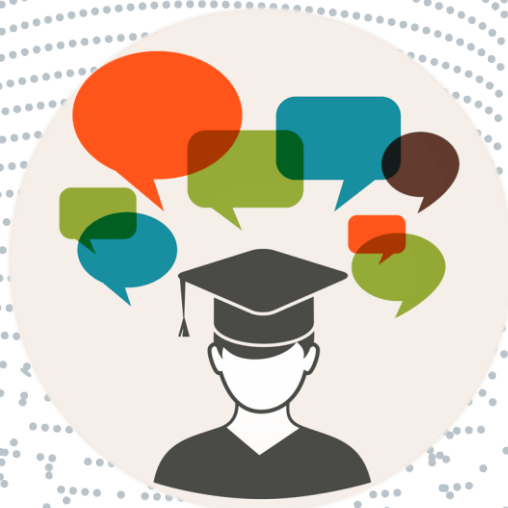
Imagem 1: exemplo.

Nulla non sem magna. Praesent purus ante, dapibus efficitur eros vel, accumsan mattis quam. Praesent bibendum eros elit, vel ullamcorper risus ultricies quis. Duis maximus sollicitudin nulla, vel aliquet diam.